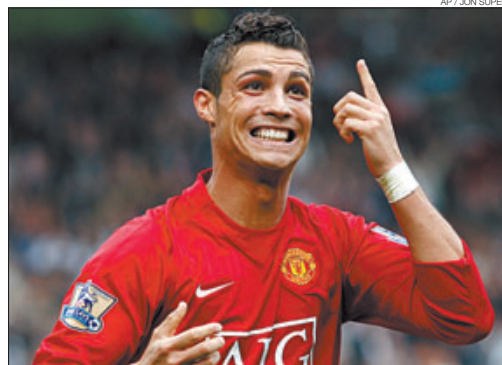
▶▶ Cristiano Ronaldo celebra un gol.

En el cuarto bombo, destaca la Fiorentina, que ha invertido más de 50 millones de euros en fichajes. Al Atlético, incluido en el grupo de cola, le espera un sorteo complicado. El Bate Borisov de Bielorrusia es la perla. Su pobre coeficiente de 1.760 puntos contrasta con los 124.996 puntos del Chelsea o los 117.837 del Barça. =