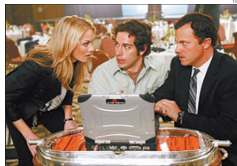
Zachary Levi (Chuck), entre Yvonne Strahovski y Adam Baldwin.