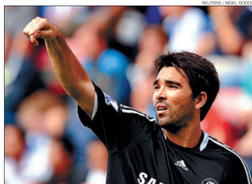
▶▶ Deco, nuevo fichaje del Chelsea, en un partido ante el Wigan.

se en las próximas horas con la llegada de Dimitar Berbatov, el habilidoso punta que estuvo en la agenda del Barça como alternativa a Etoo. El goleador del Tottenham compartiría con Ronaldo, Tévez y Rooney un póquer ofensivo de muchos quilates. El eterno Van der Saar bajo palos, el imperial Rio Ferdinand en el eje la zaga, la polivalencia de Hargreaves y el trabajo entre líneas de Scholes conforman la columna vertebral de unos red devils que quieren repetir en Roma la gesta de Moscú.