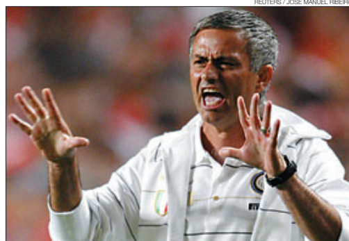
▶▶ Mourinho grita a sus jugadores en un amistoso ante el Benfica.

seguirán en Stamford Bridge, un estadio que ha recibido a Deco como un héroe. El portugués, campeón de Europa con el Oporto y el Barça, se ha puesto en el bolsillo a la grada con dos goles en las dos primeras jornadas de Liga. El exazulgrana, Essien, Ballack y Lampard conforman -con el permiso del Barça- la mejor medular de Europa. Mientras que el desembarco de Kaká se pospondrá un año, Abramovich se encomienda a su chequera para lograr que Robinho forme pareja con Drogba.